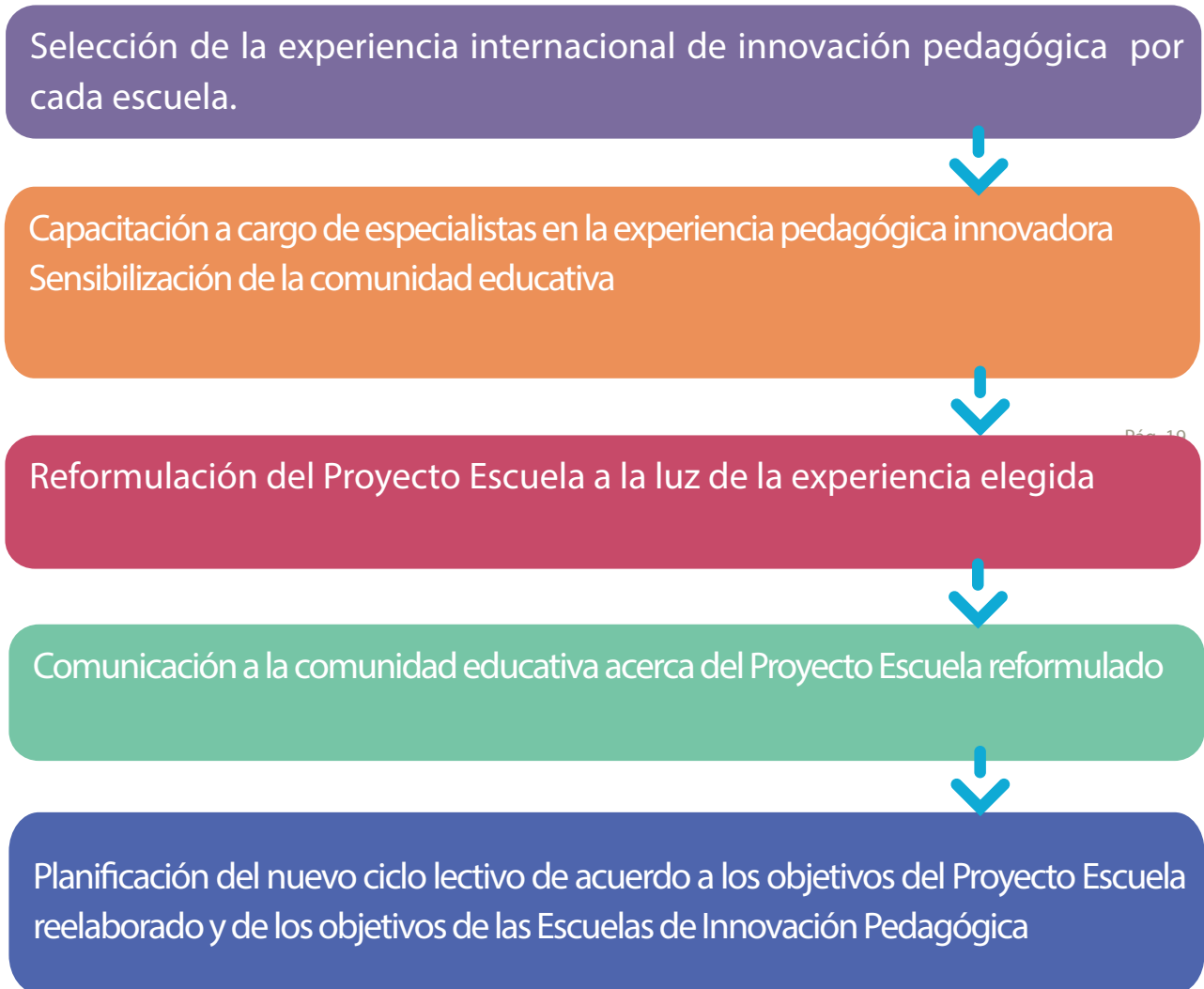
Figura 5: Síntesis del Plan de trabajo 2013 - 2014