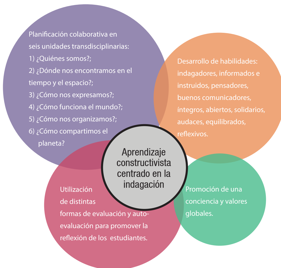
Figura 3: Características esenciales del Programa para la Escuela Primaria del Bachillerato Internacional

jóvenes solidarios, informados y ávidos de conocimiento, capaces de contribuir a crear un mundo mejor y más pacífico, en el marco del entendimiento mutuo y el respeto intercultural. Los programas que ofrece alientan a estudiantes del mundo entero a adoptar una actitud activa de aprendizaje durante toda su vida, a ser empáticos y a entender que otras personas, con sus diferencias, también pueden valorar a otras personas con sus diferencias.