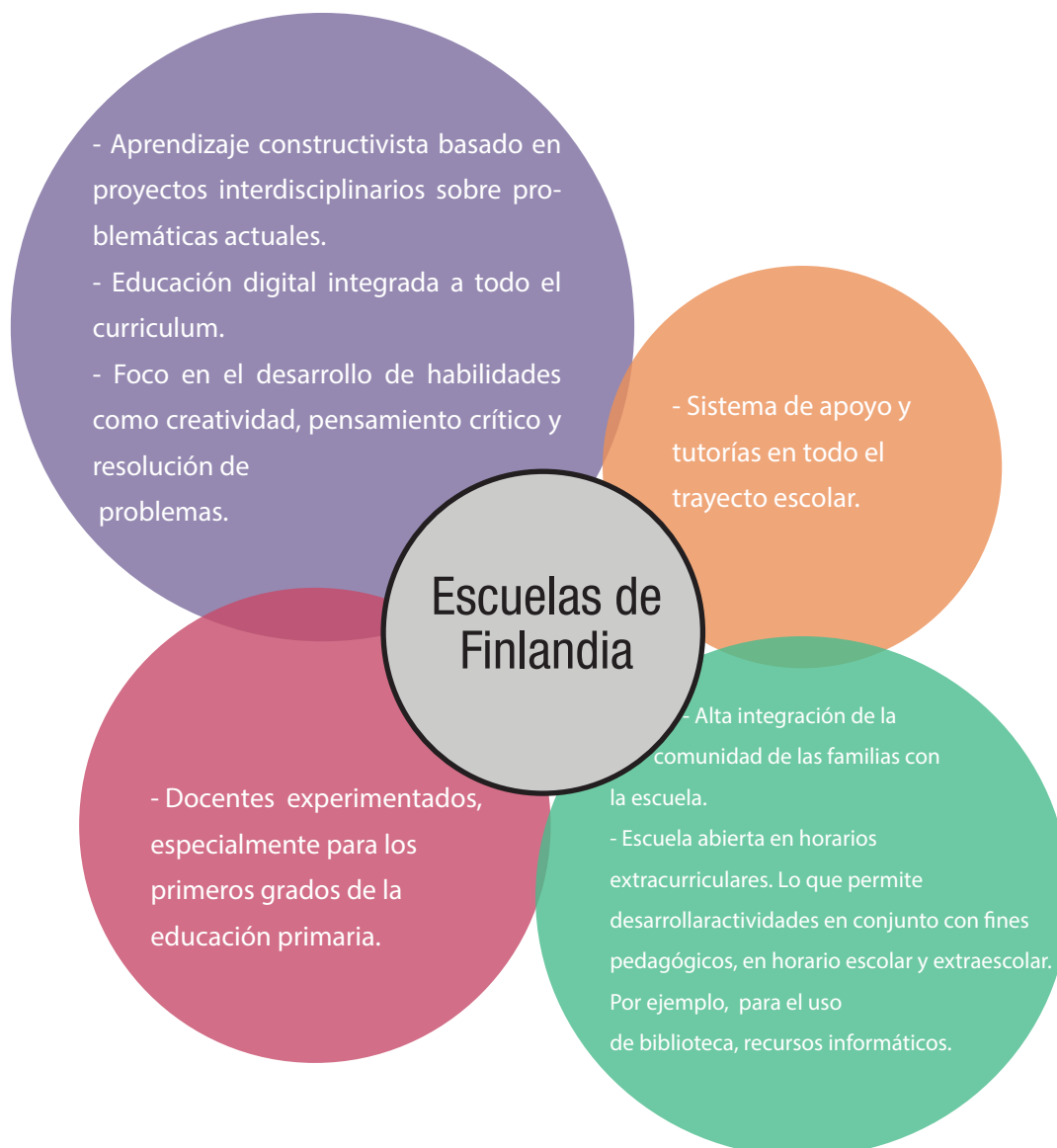
Figura 1: Características esenciales de las Escuelas de Finlandia

comienza a los 7 años y termina a los 16 años. La educación es gratuita desde el preescolar hasta la universidad. Durante los primeros seis años de la primaria los alumnos tienen en la mayoría de las materias al mismo maestro dado que entienden que es una manera de fortalecer su estabilidad emocional y su seguridad.